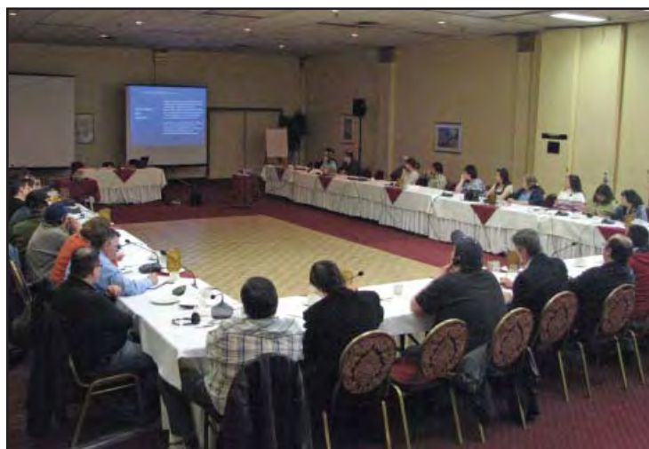
Rencontre du 27 mars dernier avec le ministère des Affaires indiennes et du Nord Canada (MAINC)

chacune de ces réunions vous sera transmis dans les meilleurs délais.