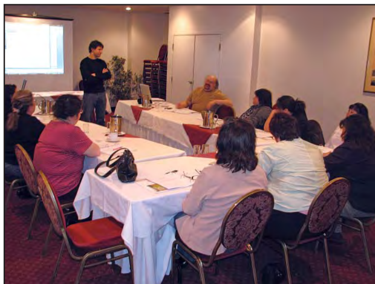
Formation des ADECs anglophones le 26 mars 2008