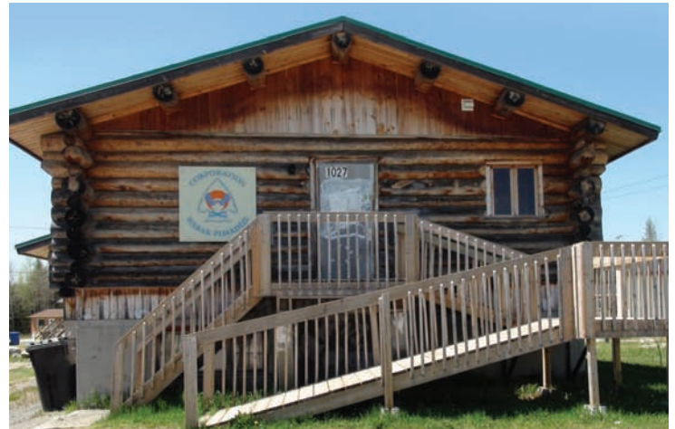
Corporation Wabak Pimadizi

Une fois les axes de développement approuvés par la communauté, trois programmes d'assistance ont été créés et