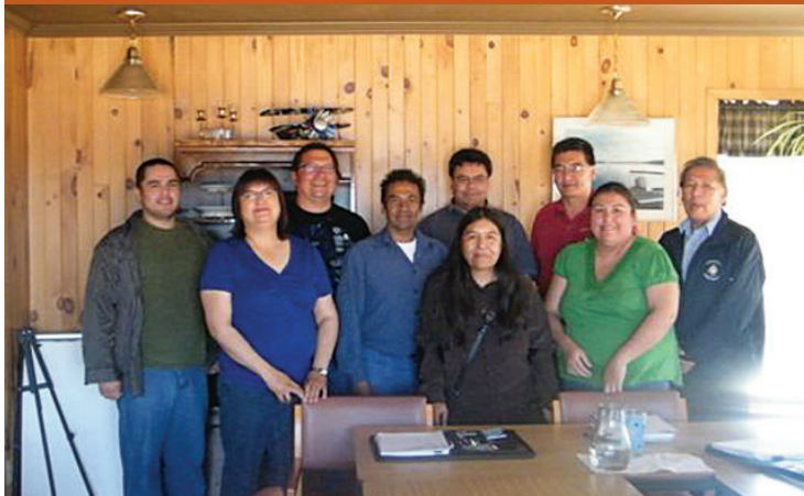
Équipe de la Corporation Wabak Pimadizi

La communauté de Lac Simon est décidément tournée vers l'avenir! En effet, ce ne sont pas les projets qui manquent pour améliorer le développement et les services de la communauté. Après l'importante restructuration qu'a subie la communauté, ce fût au tour de la Corporation Wabak Pimadizi de structurer ses actions pour la prochaine année à travers un plan d'action prévoyant la création d'entreprises et d'emplois. Les projets qui y sont prévus permettront d'améliorer la situation économique de la communauté tout en respectant les valeurs traditionnelles de la Nation Anishnabe.